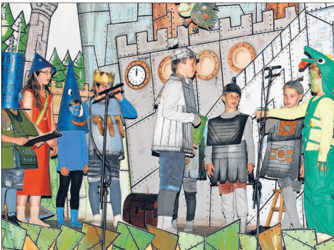
Eine erfolgreiche Premiere feierten Venninger Kinder bei der Aufführung des Kindermusicals „Ritter Rost“. Eine Fortsetzung im kommenden Jahr soll folgen.

Die 15 Darsteller präsentieren sich vor einer eindrucksvollen Kulisse in schönen Kostümen. Selbstbewusst und sicher spielen die Sechs- bis Zwölfjährigen ihre Rollen und überzeugten bei Gesangseinlagen. Unter musikalischer Leitung von Astrid Schlosser lieferte der achttimmige Chor „Die Rostigen Ritter“ schöne Begleitstimmen. Auch die Musiker in ihrer Formati-